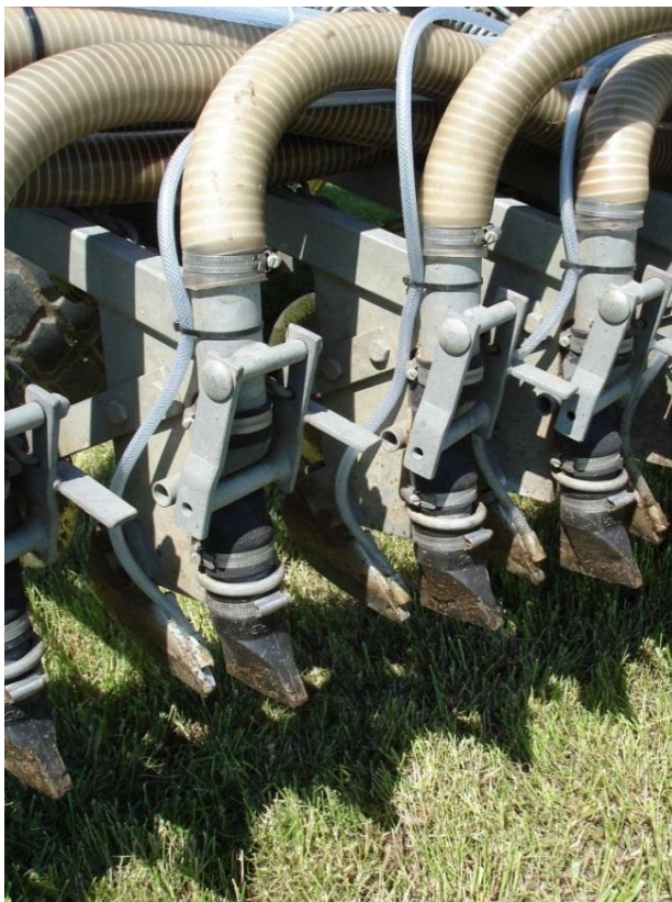
Figuur 2. Detailfoto mestinjecteur